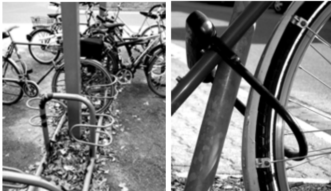
Ein sicherer Abstellplatz, stabile Schließern und eine Codierung sind die beste Voraussetzung für die Diebstahlprävention

Radlerinnen und Radler stellen zunehmend höhere Ansprüche an die technische Ausstattung ihres Rades. Damit steigt auch der durchschnittliche Kaufpreis und parallel dazu nimmt leider der Fahrraddiebstahl zu. Rund eine halbe Million Fahrräder werden jedes Jahr in Deutschland gestohlen, Tendenz steigend, aber von hundert gemeldeten Delikten werden nur weniger als zehn aufgeklärt. Ein Fahrrad-Pass, wie er als Service beim Neukauf mitgegeben wird, trägt kaum zur Aufklärung bei. Werden herrenlose Fahrräder gefunden, lassen sich die Eigentümer nur selten ermitteln. Folglich landen sie bei der nächsten Fundsachenversteigerung.