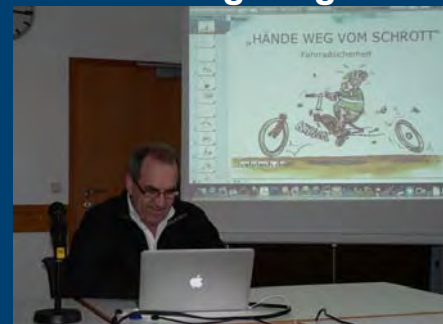
... auch die Vorträge