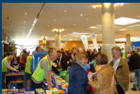
Das war FIT 2011

Berichte und Impressionen vom FahrradInfoTag