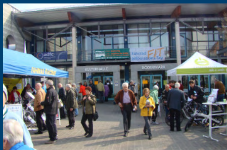
Viel los vor der Tür