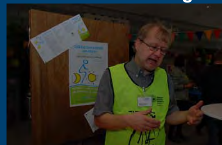
24 Stunden radeln