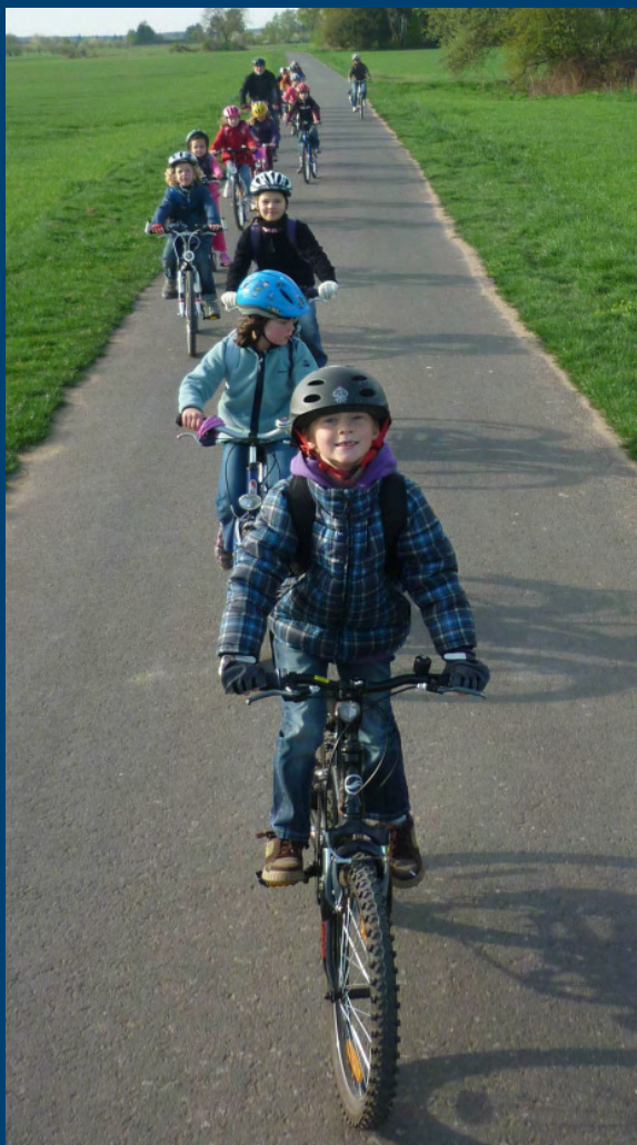
Kinder aufs Rad

Berichte und Impressionen vom FahrradInfoTag