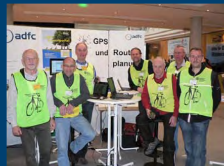
GPS ist gefragt...